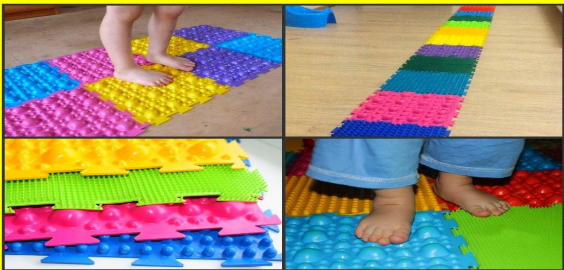
Массажные ортопедические коврики для профилактики плоскостопия